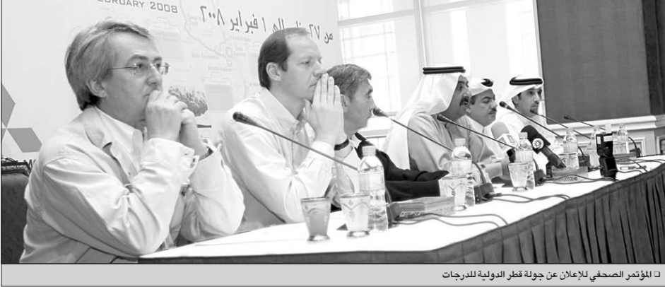
□ المؤتمر الصحفي للإعلان عن جولة قطر الدولية للدراجات